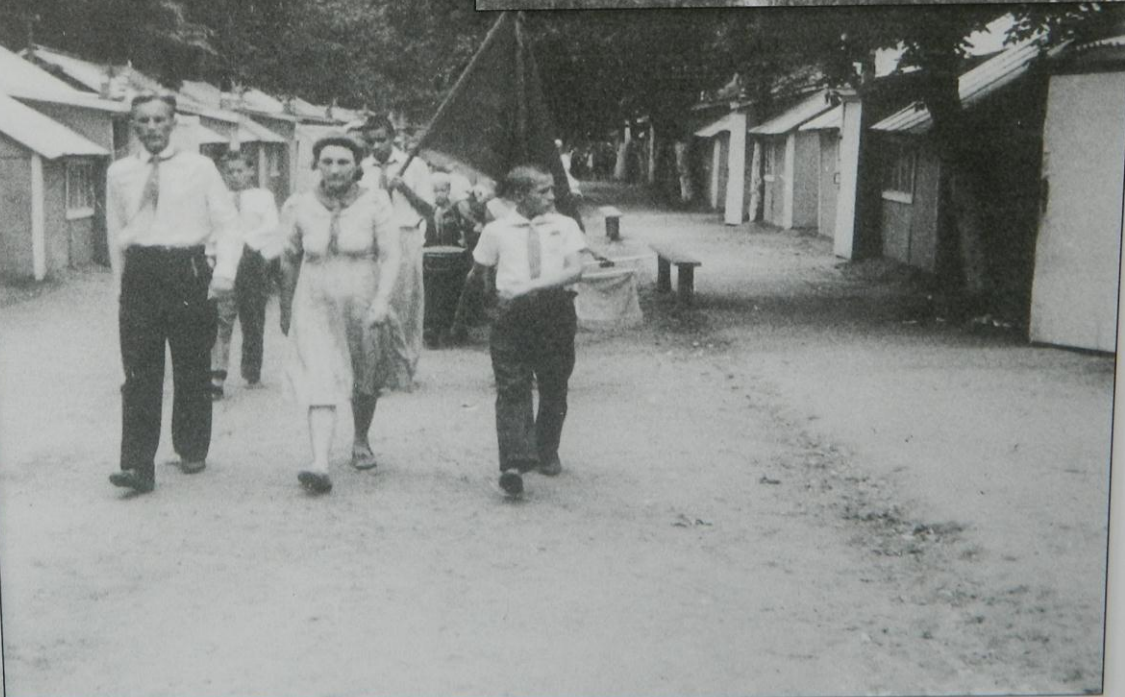
Лето перед войной, июнь.