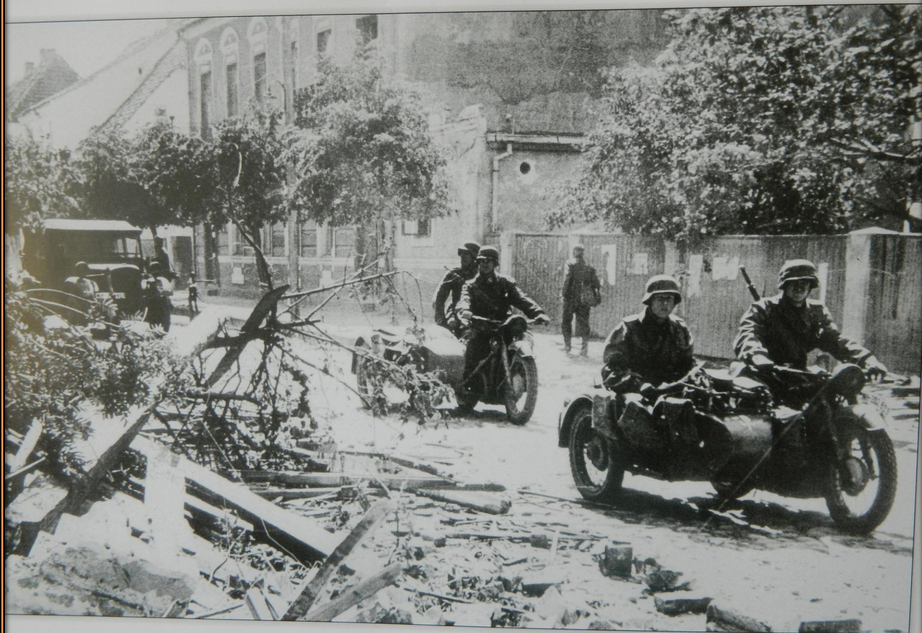
Начало войны. Фашисты в Москве.