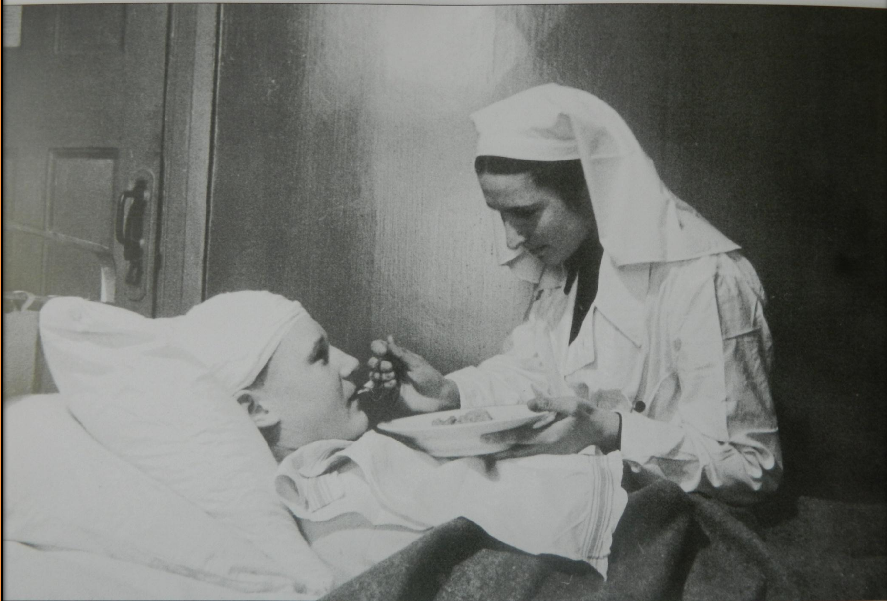
Старшая медсестра кормит раненого в госпитале.