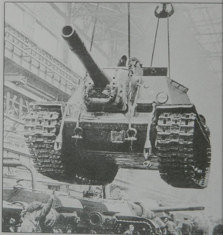
Собирали орудия на заводском