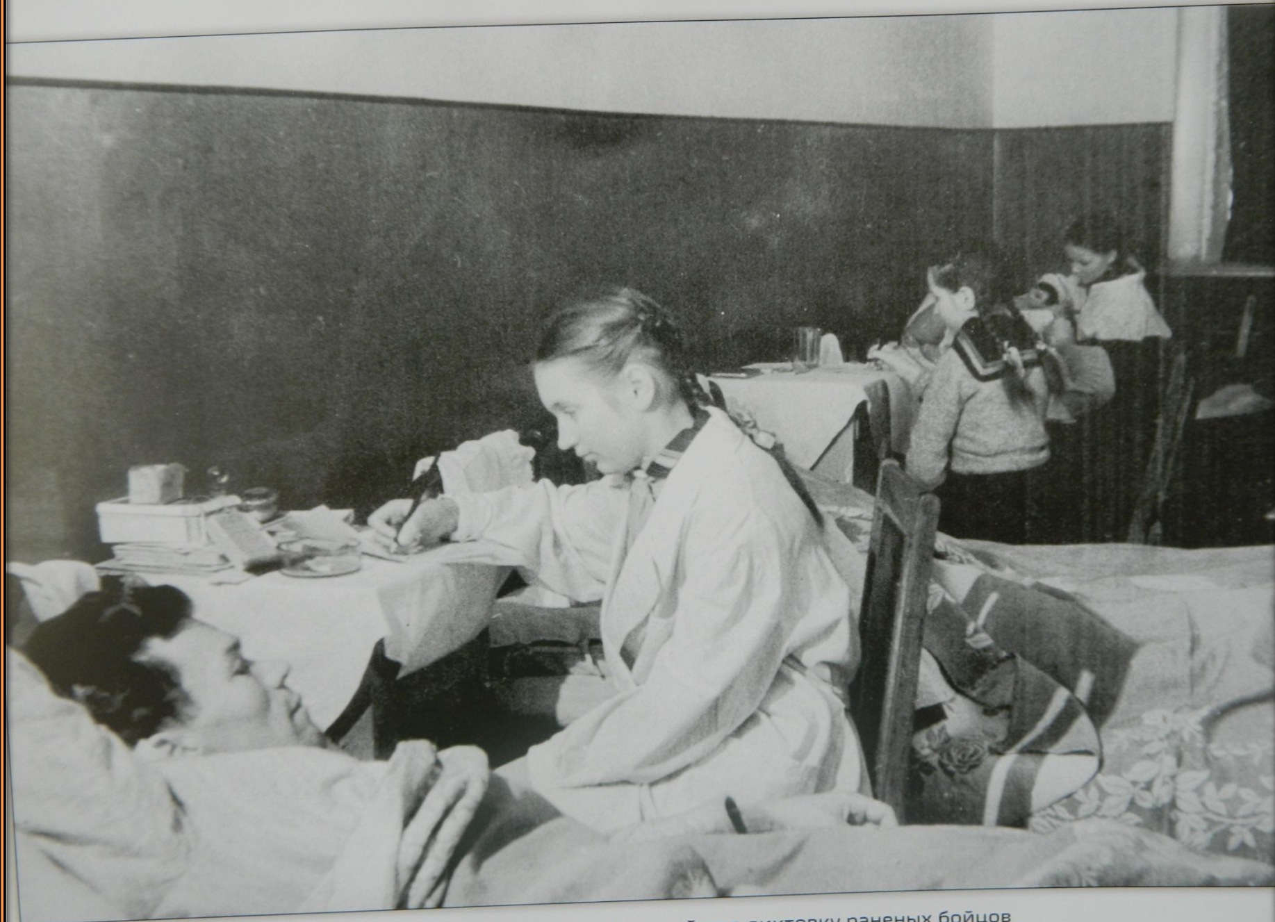
Женщины диктуют письма домой под диктовку раненых бойцов